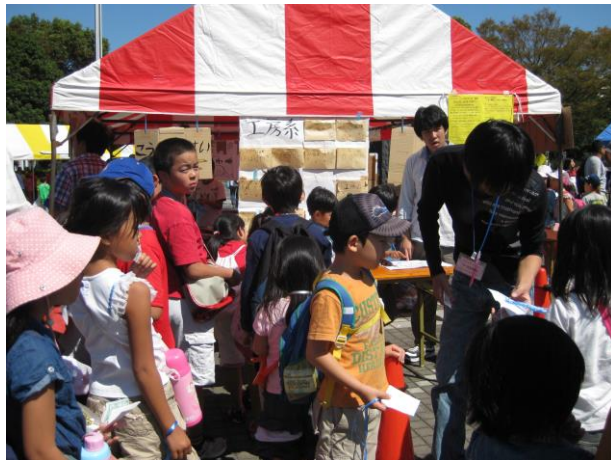
②職安で好きな仕事を探します