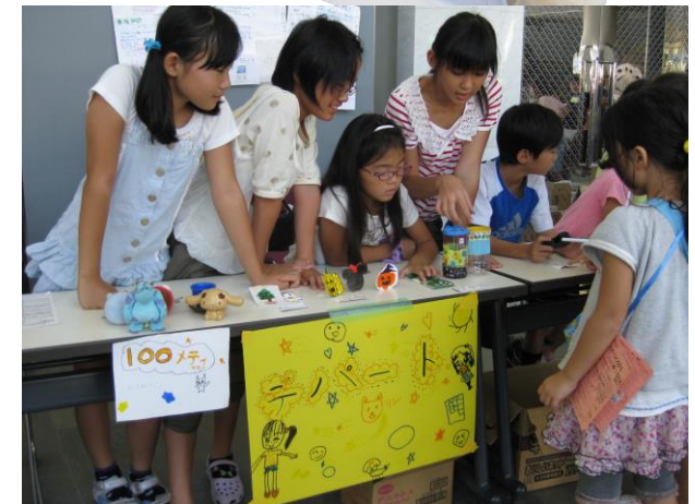
⑤もらったお金で遊んだり買い物をしたりします