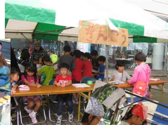
④働いた分のお給料(子どものまちの通貨)を銀行でもらいます