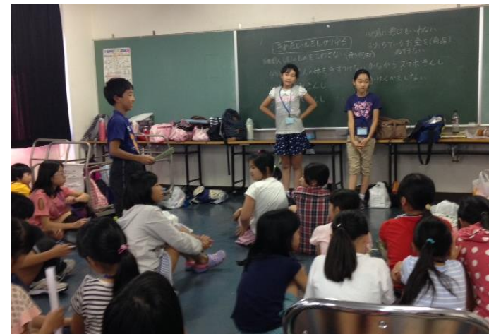
＜昨年度「子どもスタッフ会議」の様子＞

事前に集まった小学4年生以上の子どもたちが、まちのしくみやテーマ、自分がやりたいブースなどの企画をしました。