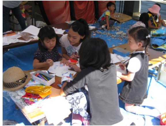
③好きなだけ働きます ↑ 保育園 ↓ 新聞社